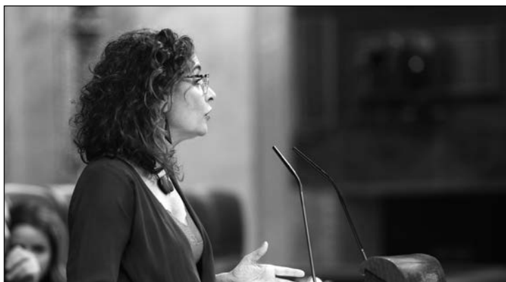
La ministra de Hacienda, María Jesús Montero.

La devolución de lo tributado por la prestación de maternidad trae de cabeza a Hacienda. La causa que lleva al Ministerio liderado por María Jesús Montero a estar en apuros es el atasco que sus oficinas sufren por varios motivos. El primero es el alto número de peticiones recibidas desde la primera semana de diciembre, fecha en la que se inició la campaña de devolución. Se dice que, en menos de un mes, Hacienda ha recabado el 70% de