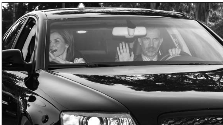
Los Reyes y sus hijas en el Audi A8 de marras.

Predicar con el ejemplo, claro está. Y en estos días de restricciones al tráfico por la contaminación, y de ecologismo por doquier, tener la etiqueta adecuada pegada en el parabrisas es una manera. Así en todas las revistas del cuore, que daban buena cuenta del Roscón que sus majestades, las de aquí, se habían tomado en honor de las de Oriente, el día de Reyes, salía la foto de la familia al completo en su coche y, en primer plano, la famosa pegatina con la C de